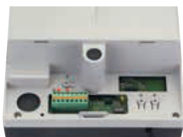
Плата управления E600 - E700HS - E1000, встроенная