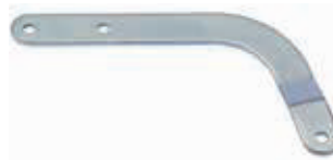
Изогнутый рычаг для секционных ворот