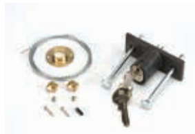
Механизм внешней разблокировки с помощью ключа, для ворот с толщиной полотна более 15 мм, с №1 по №36 (**)