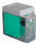
Комплект системы аварийного питания XBAT 24 *